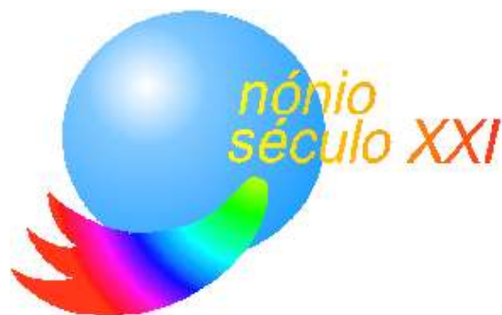
Programa Nónio Século XXI 1997 a 2004