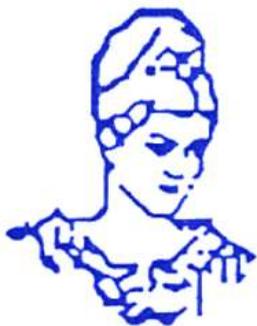
Projecto MINERVA 1985 a 1994